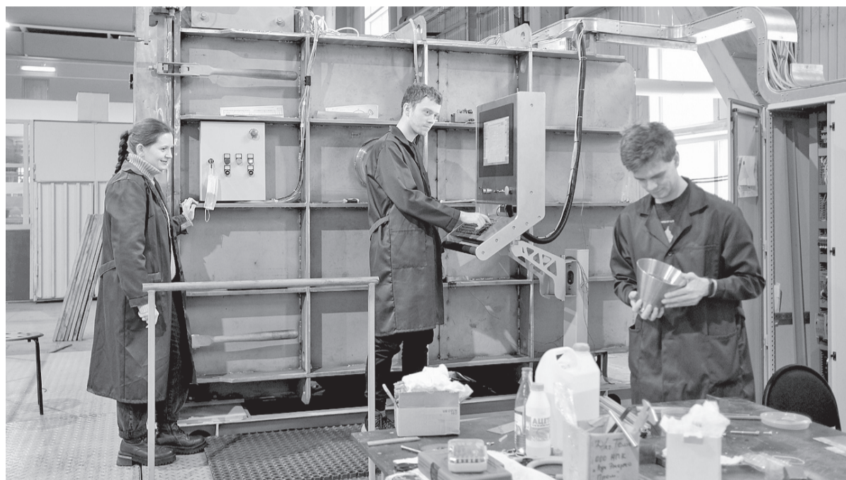
■ Сотрудники молодежной лаборатории за работой